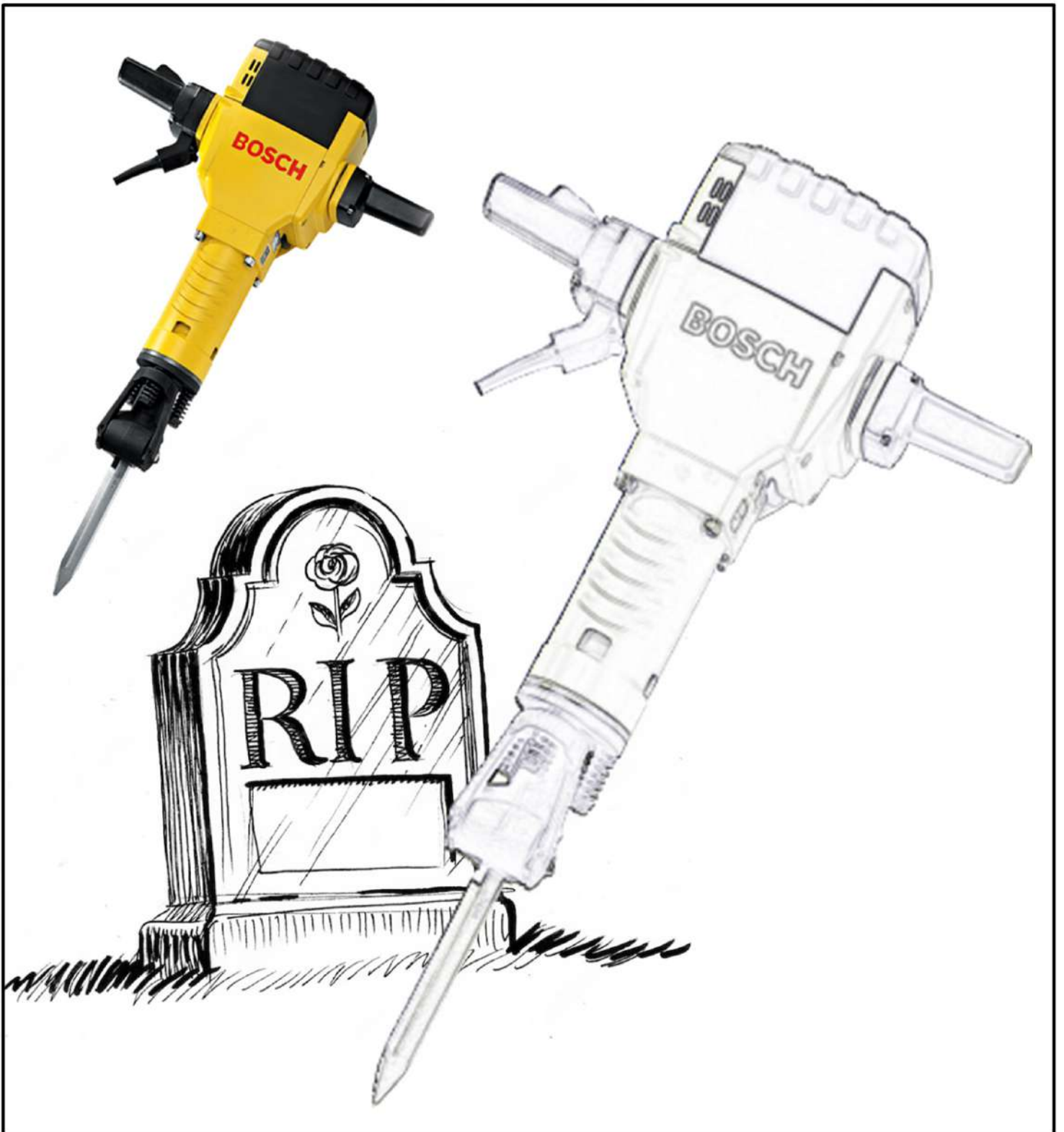
Lámina nº 4: Dos familias, obligadas a llevar su propio martillo percutor para enterrar a sus familiares en El Puerto de Santa María